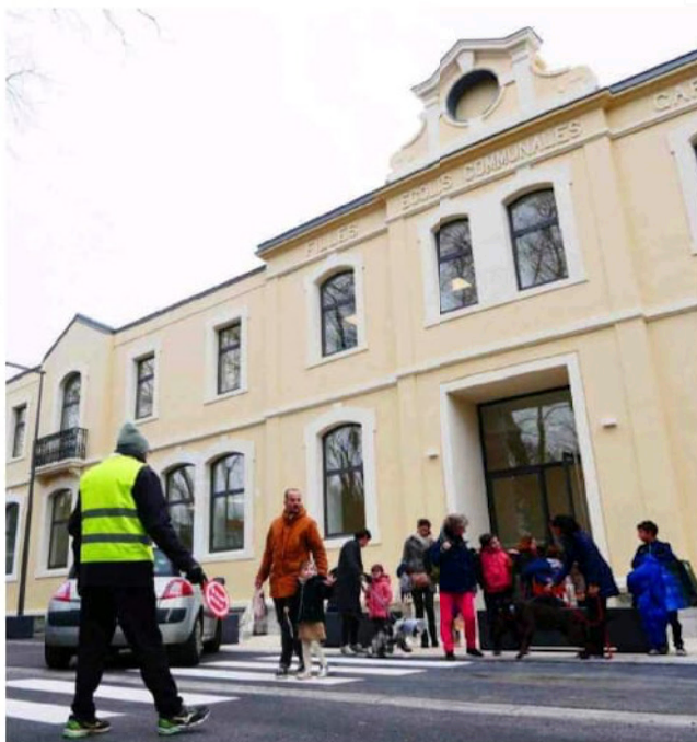
L'école des Thérmes salins a été complètement reconstruite durant le mandat écoulé. D'autres établissements scolaires doivent être repensés selon plusieurs candidats.